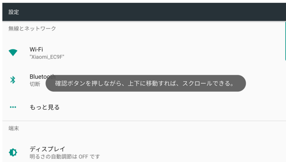
[システム設定画面]